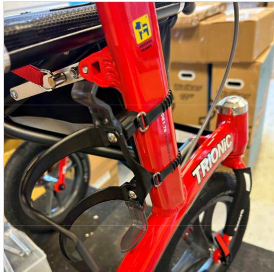
⑧ Flaskhållaren är nu fäst på ramen och du för in flaskan från sidan och tar ut den utåt.