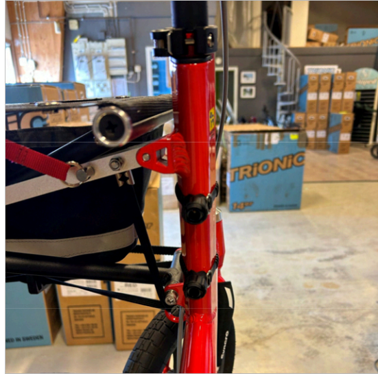
⑥ De två hållarna är korrekt monterade på ramröret.