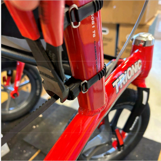
⑤ Montera den andra hållaren på samma sätt.